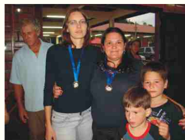
2º lugar: Auto Escola Guarimir