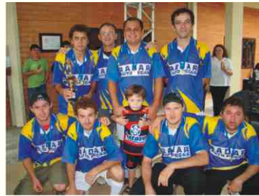
1º lugar: Radar Auto Peças