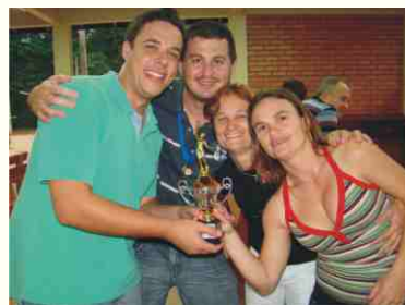
2º lugar: Auto Escola Guarimir