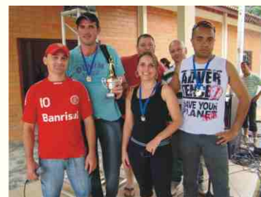
3º lugar: Casas Bahia (B)