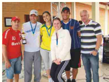
1º lugar: Casas Bahia (A)