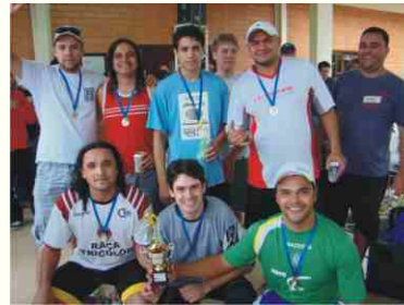
2º lugar: Peugeot/Renault/Citroen