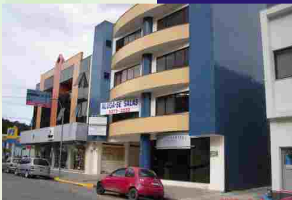
Sub-sede fica na rua 28 de agosto

Trabalhadores e Sindicato, juntos, podem fazer muita coisa. Participar é acreditar no valor do trabalho como fonte de vida, crescimento e realização, não de escravidão e infelicidade.